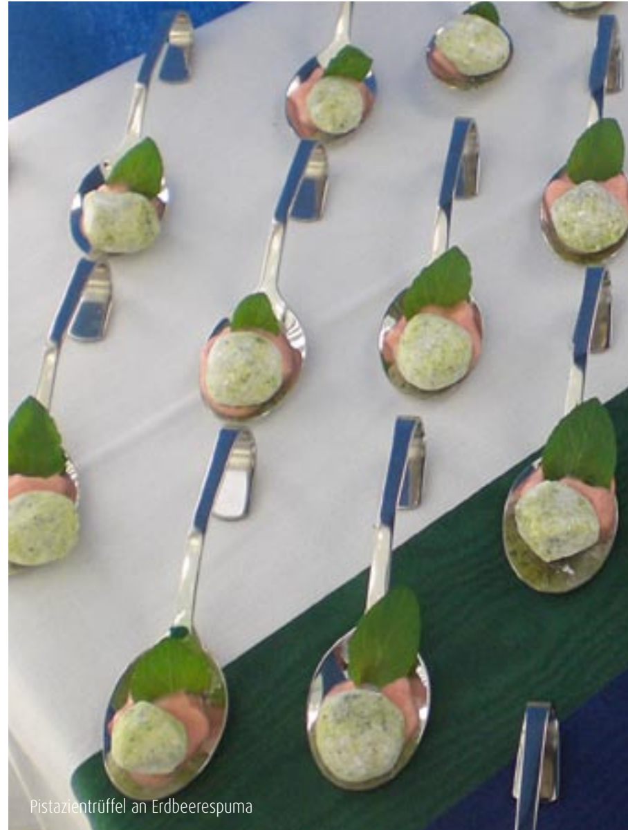
Pistazienrüffel an Erdbeerspuma